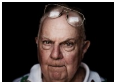
Donald au 21eme siècle.